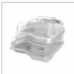
HumidAir uppvärmd befuktare 37300 rengöringsbar behållare