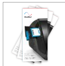
Skyddsfodral för SD-kort 37334 (1-pack) 37332 (10-pack) SD-kortläsare 36931