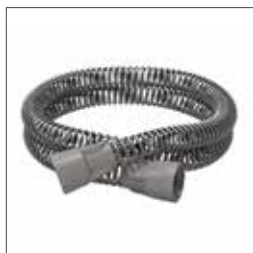
SlimLine™ luftslang 36810