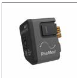
Oximetrimodul 37302 Xpod LP oximeter 22374 Återanvändbar softsensor (medium) – 3 meter kabel 707560