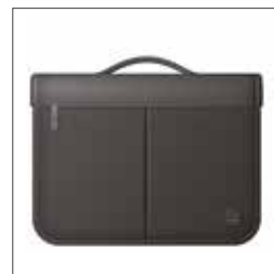
Transportväska 37304 Transportväska for Her 37305