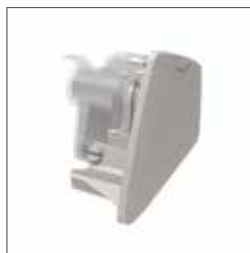
Sidlock 37335 Grått 37303 Svart