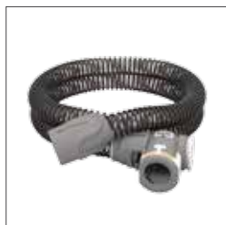
ClimateLineAir™ uppvärmd luftslang 37296