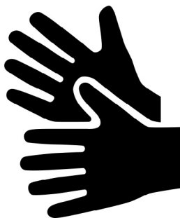
Tecknet betyder Teckentolkat