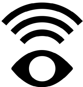
Tecknet betyder Syntolkat