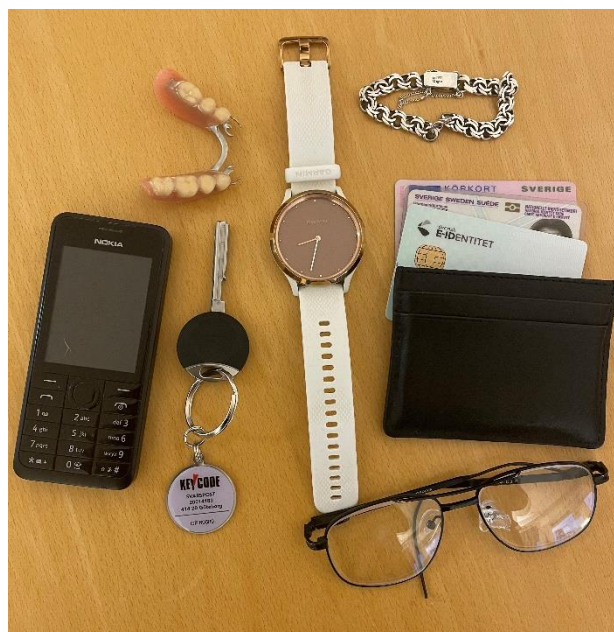
Exempel - Värdesaker